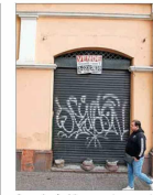
Consejo de Monumentos constató las malas condiciones del lugar.

DESDE LUCES LED HASTA ENERGÍA SOLAR Y ARTEFACTOS EFICIENTES: CÓMO AHORRAR EN EL CONSUMO ELÉCTRICO | B 4