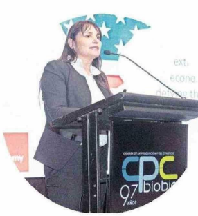
La destacada economista Michéle Labbé fue la encargada de exponer en la actividad.