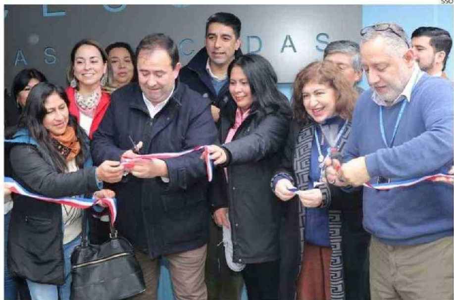
AUTORIDADES Y LA COMUNIDAD ESTUVIERON PRESENTES EN LA INAUGURACIÓN DEL RECINTO.