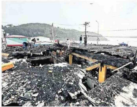
TRABAJO DE REMOCIÓN DE ESCOMBROS COMENZARÁ HOY.

Pablo Martínez Tizka cronica@estrellaconce.cl