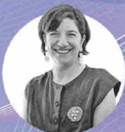
AISÉN ETCHEVERRY Ministra de Ciencia, Tecnología, Conocimiento e Innovación.