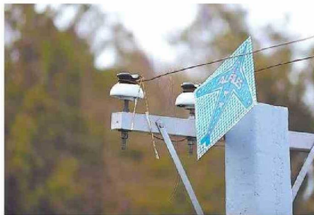
EL LLAMADO ES A ENCUMBRAR LEJOS DE POSTES Y AUTOPISTAS.

"Ha habido casos de gente que ha perdido sus dedos, sus manos, porque pasan por ahí sin darse cuenta e incluso hay gente que ha fallecido: para la gente que anda en motoci-