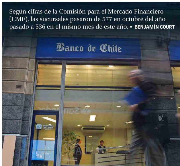
El Banco de Chile lidera la lista de cierres de sucursales durante 2023 y hasta octubre pasado.

mientos de los clientes, sin la necesidad de asistir presencialmente a una oficina.