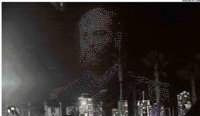
IQUIQUE UTILIZÓ DRONES PARA MOSTRAR IMÁGENES SIGNIFICATIVAS PARA LA CIUDAD, COMO ARTURO PRAT.