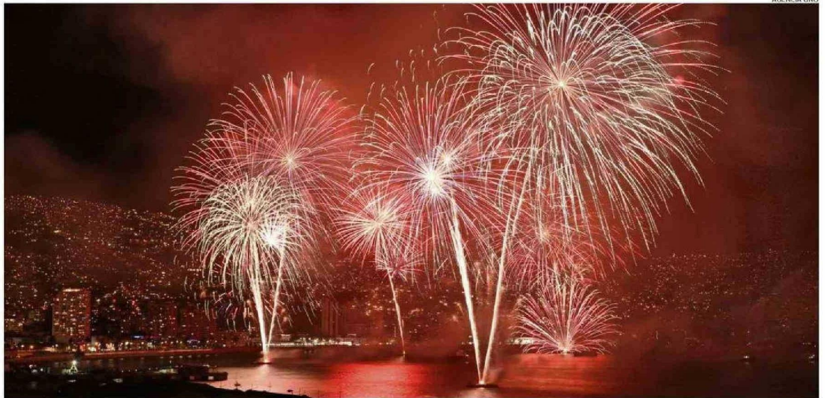
VALPARAÍSO TUVO UN SHOW PIROTÉCNICO DE 18 MINUTOS CON LANZAMIENTOS DESDE DIEZ PUNTOS DISTINTOS DE LA COSTA DE LA CIUDAD PUERTO.

Japón se alzó con el récord del fuego artificial más grande del mundo: en Nagaoka lanzaron "Yonshakudama", que requirió de 420 kilos de material pirotécnico. Los drones siguieron ganando terreno en países asiáticos como China, mientras que algunas ciudades chilenas como Iquique también se aventuraron a usar la tecnología.