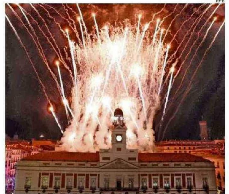
LA PUERTA DEL SOL DE MADRID TUVO SUS FUEGOS ARTIFICIALES.