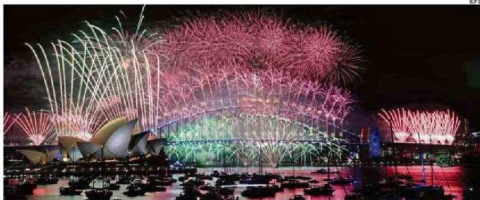
SIDNEY RECIBIÓ EL 2025 CON UN ESPECTÁCULO PIROTÉCNICO COLORIDO.