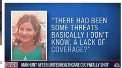
"THERE HAD BEEN SOME THREATS BASICALLY I DON'T KNOW, A LACK OF COVERAGE?"