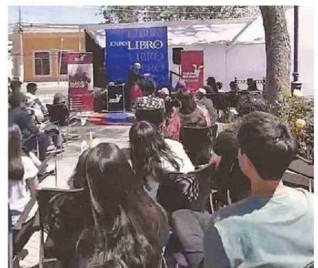
NUEVAMENTE LA EXPO TENDRÁ COMO LOCACIÓN LA PLAZA.

Uno de las razones de hacer la Expo en la misma plaza de Quillota, es poder motivar a niños y adultos a que lean y se acerquen al