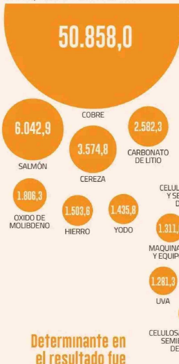
PRODUCTOS EXPORTADOS QUE SUPERARON LOS US$ 1.000 MILLONES EN 2024

Determinante en el resultado fue el cobre, cuyas ventas al exterior llegaron a US$ 50.858 millones. Entre las frutas, se reafirmó el estrellato de las cerezas.