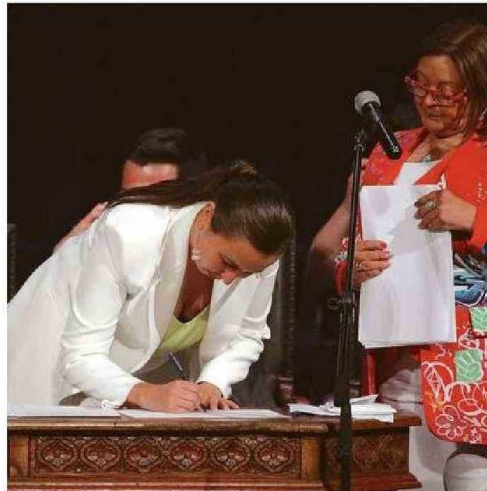
LA TAMBIÉN ABOGADA ASUMIÓ EL CARGO EL 6 DE DICIEMBRE.

manas a las personas del eje del Congreso.