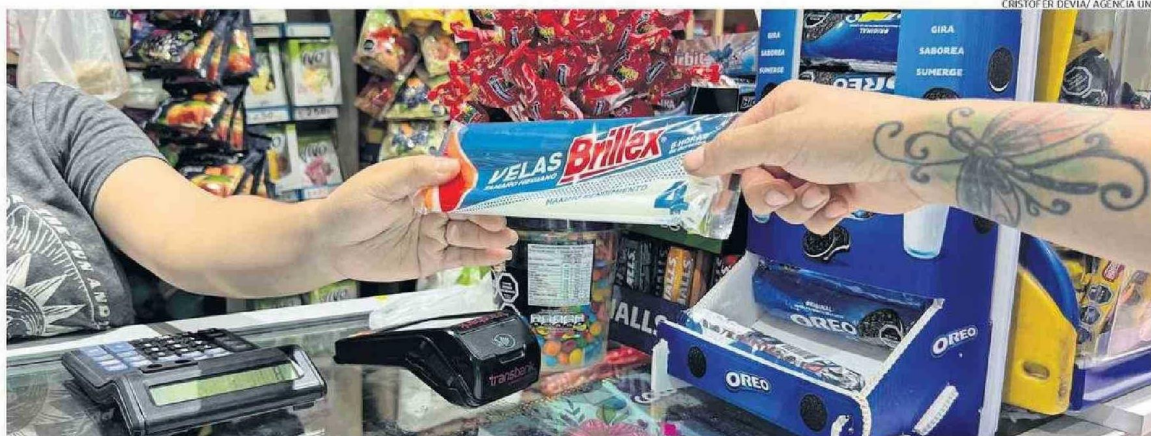
EL CORTE DE LUZ AFECTÓ A 14 REGIONES DEL PAÍS. EN LA REGIÓN FUERON MÁS DE 160 MIL CLIENTES QUE SE VIERON PERJUDICADOS POR EL CORTE DE SUMINISTRO.

EMERGENCIA. Mientras que la totalidad de personas ya estaban con servicio energético, se registraron cortes de agua por problemas en la planta.