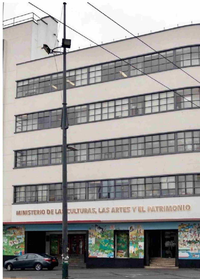
► El actual presupuesto de Cultura alcanza el 0,44% del total de la nación,

La incertidumbre, eso sí, persiste. "No tenemos apuestas de cuál será el resultado", cierra Rebollovedo. ●