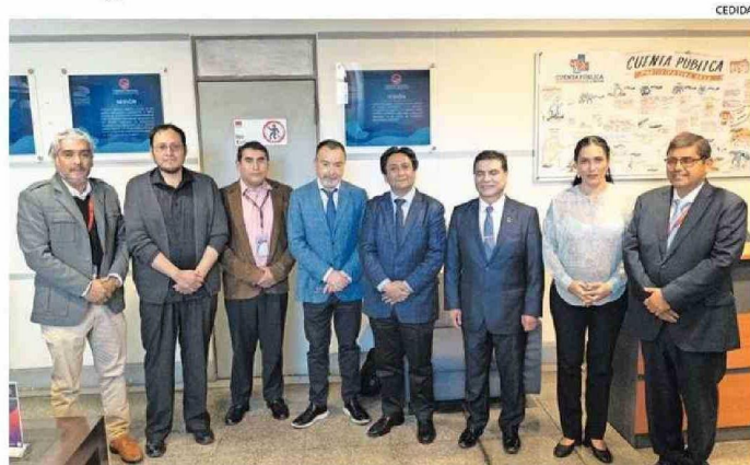
TUVO COMO OBJETIVO PRINCIPAL DESARROLLAR UNA AGENDA DE TRABAJO.

Encuentro entre los sectores público, académico y privado, abordó las oportunidades y desafíos de la nueva industria de energías renovables en la zona.