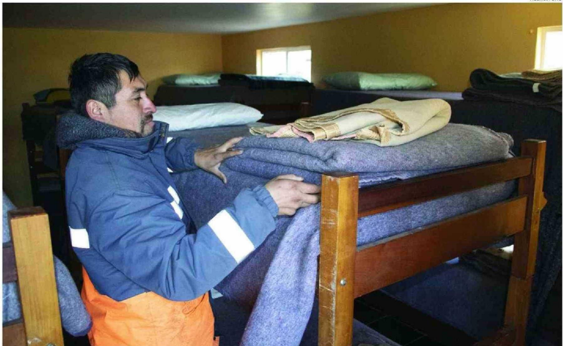
LOS ALBERGUES PÚBLICOS O PRIVADOS, COMO EL LUBICADO EN RAHUE ALTO, AL LADO DE LA PARROQUIA SAN LEOPOLDO MANDIC, SON UNA OPCIÓN PARA PASAR LAS FRÍAS NOCHES.

Según reportes del Midesof, la cifra para 2024 de personas en situación de calle llega a 21.272, donde la mayoría se concentra en la regiones Metropolitana, de Valparaíso y Biobío. En el caso de Los Lagos, está en una posición intermedia, con cerca de 1.500 personas