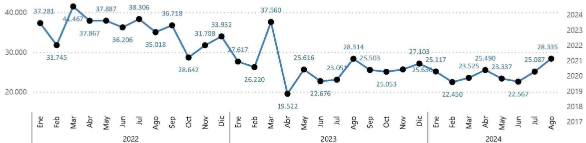
Venta a público del Mercado de Livianos y Medianos

En el desempeño por regiones las que más crecieron en agosto fueron Tarapacá (46,8%), General Carlos Ibañez del Campo (21,7%) y Maule (18,2%). La Región Metropolitana concentró el 55,8% de las ventas de cero kilómetros en el mes, esto es, un crecimiento de un 0,5%, seguida de la Región de Valparaíso que representa un 9,4% del total de ventas a nivel nacional.