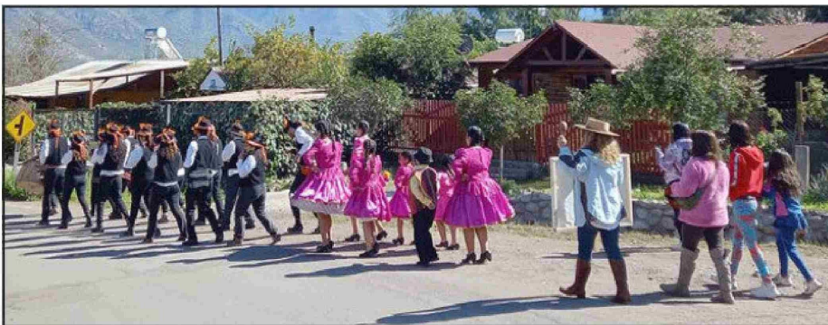
Pasacalle de ‘Lakitas Akunkawa’ junto a ‘Raíces de Mi Tierra’ durante la ‘Fiesta del Quisquito Rosado de Las Coimas’.