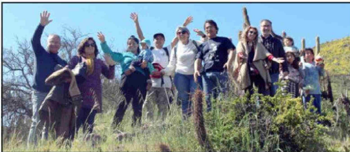
‘Sendero del Quisquito Rosado’ consistió en visitas guiadas a la serranía del cerro del sector, correspondiente al hábitat del cactus.