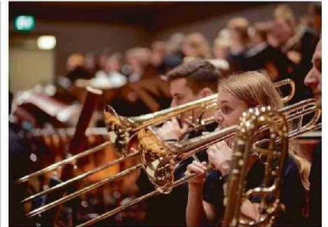
LA AGRUPACIÓN ES UNA DE LAS MÁS RECONOCIDAS EN EUROPA.