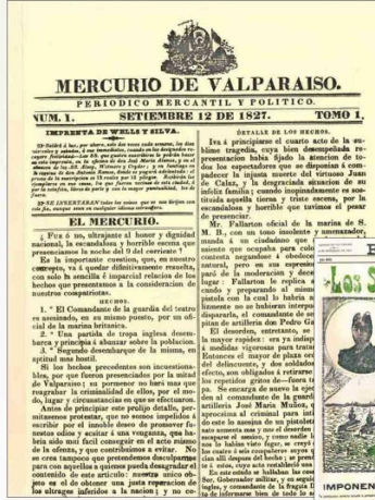
El 12 de septiembre de 1827 se publicó la primera edición de El Mercurio de Valparaíso.

Crónica del Futuro circulará después de las próximas elecciones muni-