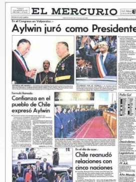
En casi 200 años, esta casa periodística ha presenciado los principales hitos de la historia del país.

casa periodística busca hacer un aporte para no solo dar cuenta del estado actual de los principales problemas que lastran el desarrollo del país, sino también intentar identificar eventuales nuevos desafíos y proyectar posibles soluciones de la mano de conocimiento experto y del conocimiento veraz de los hechos.