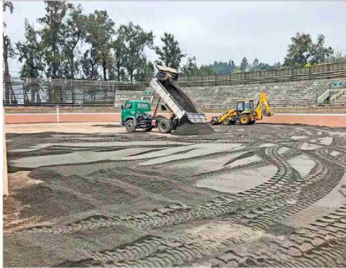
Diversos trabajos se realizaron en la medialuna monumental de Curicó.