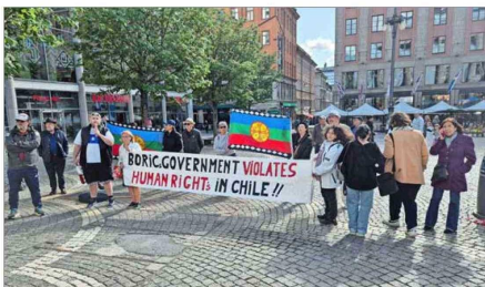
La delegación chilena se encontró con manifestaciones que acusaban al Gobierno de transgredir los derechos humanos, en Estocolmo.

referente, mientras que su par Lorena Pizarro indicó que “me parece que es un insulto pensar que los países de Latinoamérica no saben quién es Vladimir Putin o que creamos que sea de izquierda”.