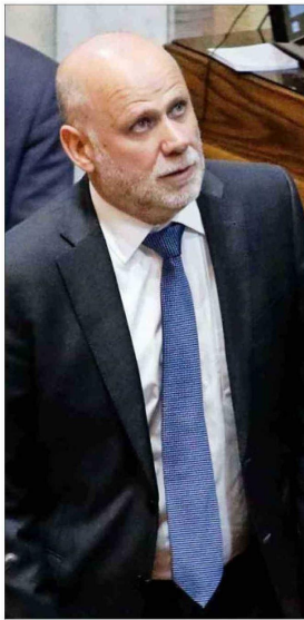
Álvaro Elizalde, ministro Segpres.

Ministra Vallejo indicó que la seguridad y pensiones son el interés número uno del Gobierno y su par Elizalde llamó a la responsabilidad a los legisladores y esperar que se presente el proyecto educativo.