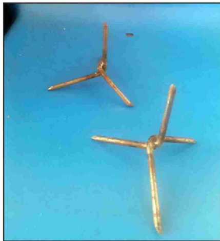
Los delincuentes al momento de huir lanzaron miguelitos en calle Portus para evitar su persecución.

nadie, solo bajaron la cortina cuando ya los asaltantes se habían ido, parece que no atinaron a nada, solo se daban vueltas al fondo, mujeres y un hombre.