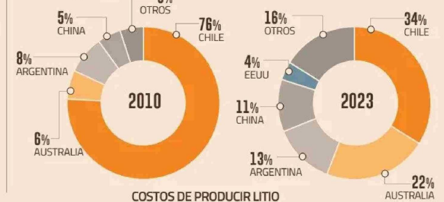
COSTOS DE PRODUCIR LITIO OPERACIÓN (PAÍS)