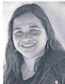
Autora: Carla Iglesias Fernández

ron ante la vista impresionante de la erupción del Rukapillán.