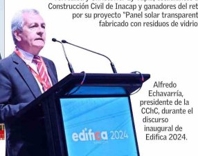
Alfredo Echavarría, presidente de la CChC, durante el discurso inaugural de Edifica 2024.