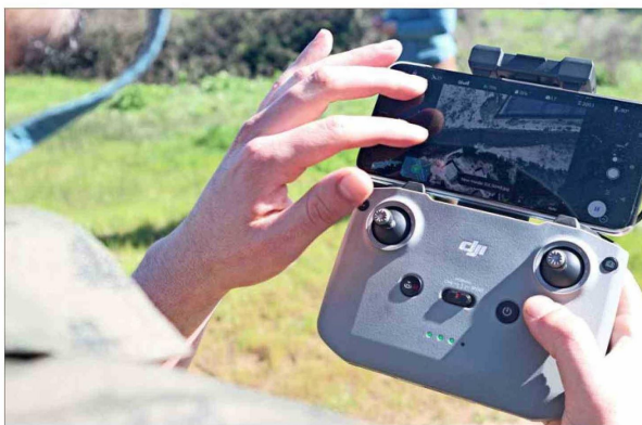
Una de las formas con las que entrenaron a los algoritmos de IA fue con fotos de alta resolución de la bahía de Quintero tomadas por dron.

Sin embargo, las técnicas tradicionales son lentas y costosas. "La bahía de Quintero es grande, son cerca de 5 kilómetros por 3 kilómetros. Entonces, hacer estudios de prospección arqueológica (técnicas y métodos que los arqueólogos utilizan para localizar y estudiar restos del pasado) en un área tan grande como esa es muy lento y además