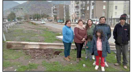
Vecinos de Villa Sol del Inca, Jardines del Valle, junto a uno de los postes botados por un camión.