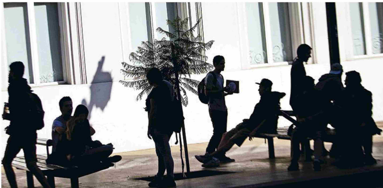
► El pago se comenzará a realizar un año después de que el solicitante ingrese al mundo laboral.