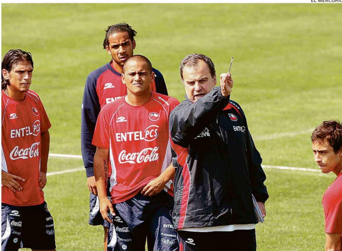
CON BIELSA SE VOLVIÓ A CREER EN EL FÚTBOL AL REGRESAR AL MUNDIAL EN 2010 TRAS 12 AÑOS.