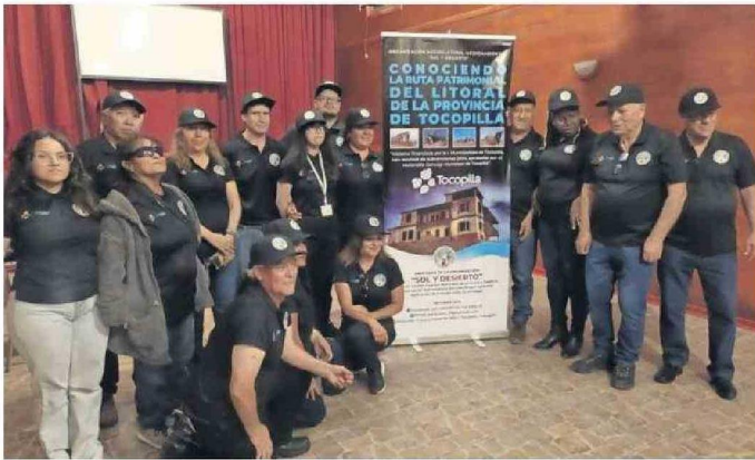
LOS INTEGRANTES DE LA AGRUPACIÓN SOL Y DESIERTO DE TOCOPILLA.