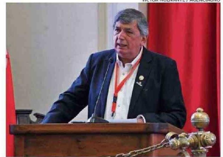
EL LÍDER DEL PC, LAUTARO CARMONA, EN EL SEGUNDO DÍA DE REUNIÓN.