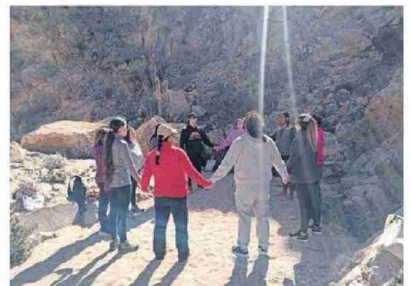
HUBO UNA MUY BUENA ACOGIDA Y EVALUACIÓN.