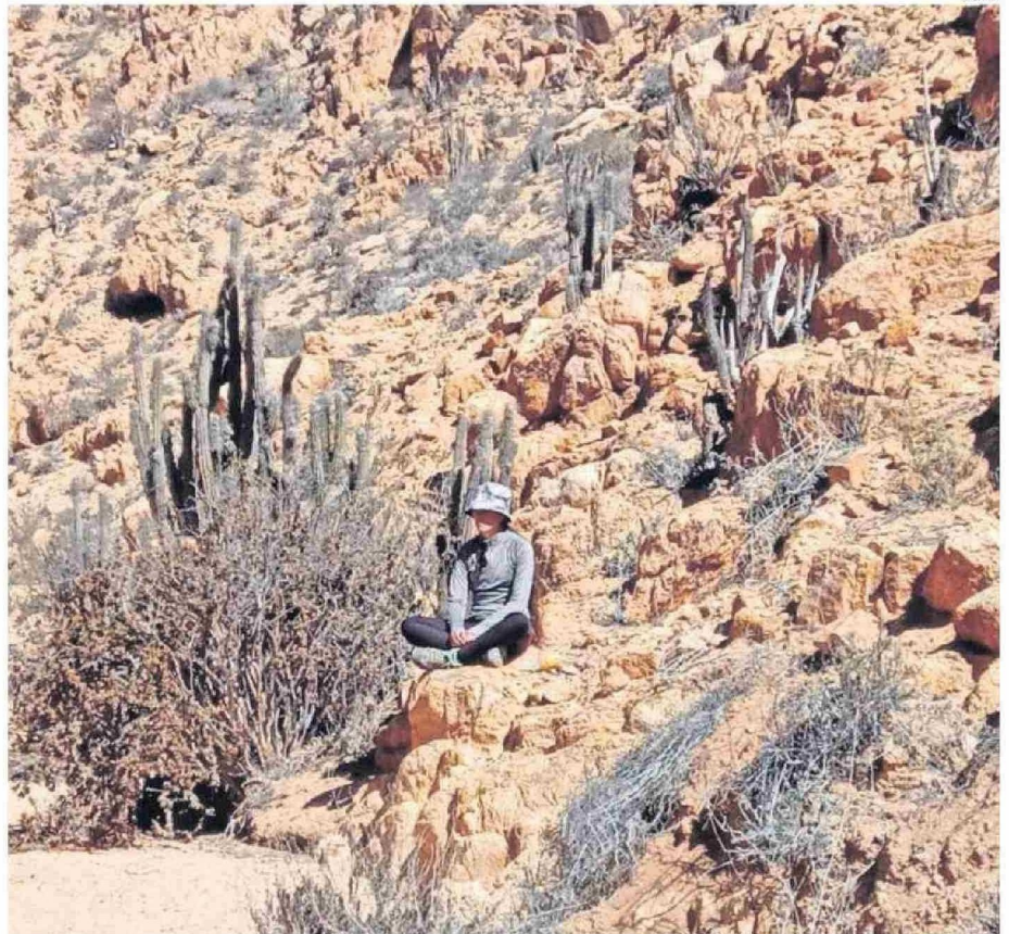
LA ZONA TIENE MAYOR VEGETACIÓN Y CONCENTRACIÓN DE BIODIVERSIDAD, ADEMÁS DE SER UN SITIO LIBRE DE CONTAMINACIÓN ACÚSTICA.