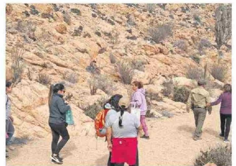
ES UN SERVICIO COMPLEMENTARIO A LA SALUD TRADICIONAL.