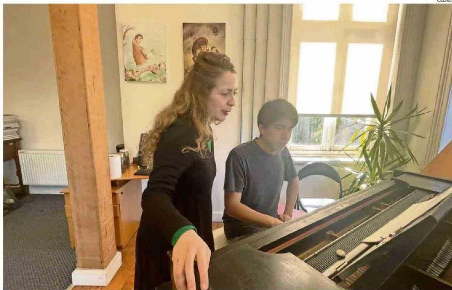
"ES IMPORTANTE ADAPTAR LA FORMACIÓN A LAS NECESIDADES DEL INTÉRPRETE, MANTENIENDO LA RIGUROSI- DAD TÉCNICA", AFIRMA LA ACADEMICA.

Contamos con distintas menciones, con una duración que varía entre 10 y 12 años más la etapa de titulación. Actualmente, el programa se estructu-