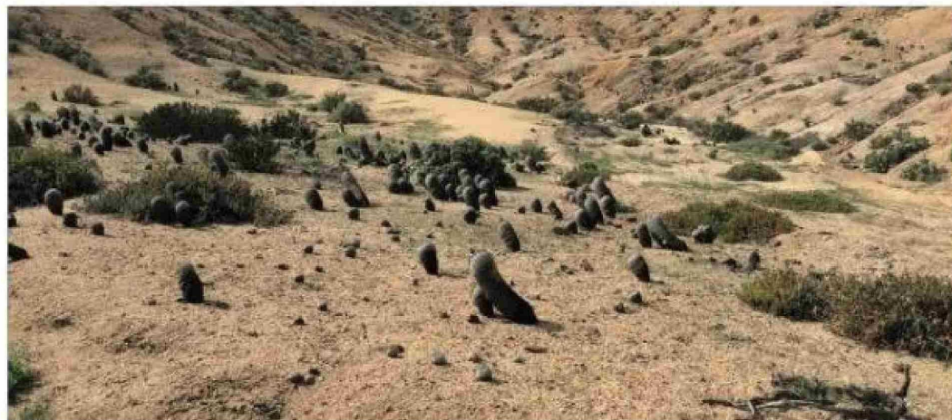
Hay un tráfico ilegal de cactus copiapoa, que está en Chile, y llega a otras regiones del mundo. Varias de las especies de cactus están en riesgo ahora.