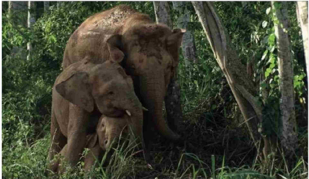
Quedan muy pocos ejemplares del elefante de Borneo en el sureste asiático, según la Unión Internacional para la Conservación de la Naturaleza.

"El cambio climático amenaza aún más a estos cactus, ya