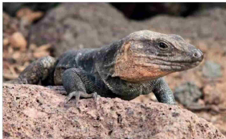
El lagarto de Gran Canaria está en peligro por una serpiente invasora.