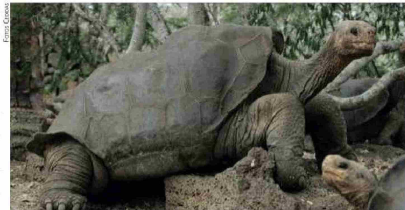
La tortuga gigante Solitario George fue el último ejemplar de una especie que se extinguió en el mundo. Estaba en las Islas Galápagos.