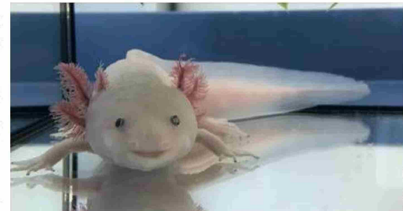
El ajolote es una especie de anfibio que ha tenido una gran influencia en la cultura mexicana. Hoy sus poblaciones están en peligro crítico.