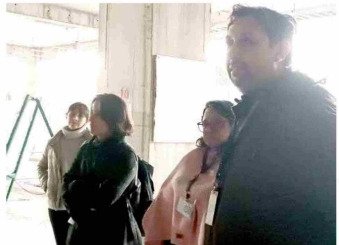
Colegio Médico, visitando la construcción del nuevo Hospital de Linares.