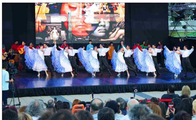
EL BALLET FOLCLÓRICO UDEC se presentó al cierre de la jornada de ayer, abriendo a la vez las actividades musicales y escénicas que tendrán como escenario el Foro.

La Pinacoteca fue el escenario donde el director ejecutivo de la editorial Fondo de Cultura Económica abordó a grandes rasgos la extensión universitaria y la necesidad de reavivar el interés por la lectura entre los adolescentes, entre otros temas. Esta primera jornada se cerró con la presentación del Ballet Folclórico UdeC en el Foro de la casa de estudios.