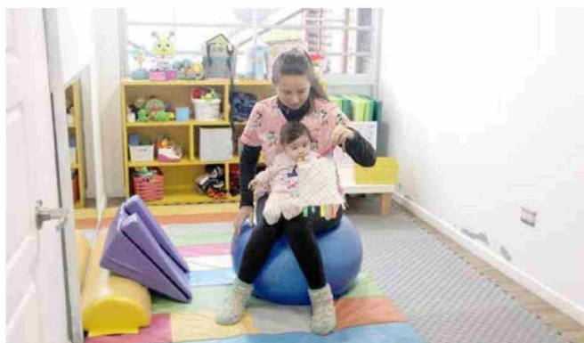
La mayoría de los pacientes son niños.

El profesional contó que en la entidad se atiende un centenar de familias, por ejemplo, "de Curicó, Molina, Teno, Romeral, Rauco y Licantén". Si hay alguna persona interesada puede obtener más información, en la página de Instagram o acudir al recinto, ubicado en Buen Pastor #341 de Curicó.