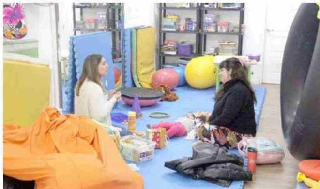
Recinto entrega una atención integral.

Tiraje: 4.200 Lectoría: 12.600 Favorabilidad: No Definida