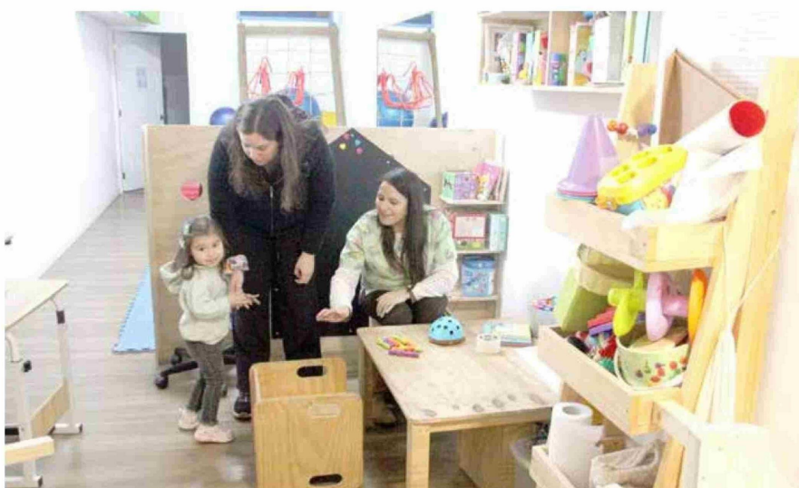
Organización cuenta con una cómoda infraestructura.