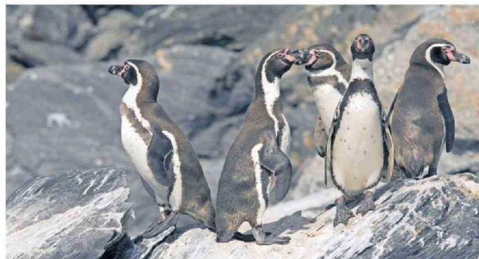
Los pingüinos de Humboldt son los protagonistas de un capítulo lleno de sus curiosidades.

"Esto es una clara señal de que las audiencias buscan contenido de calidad, entretenimiento pero, por sobre todo, significativo desde el patrimonio, cultural, social, natural y geográfico", valoró la productora general de la serie.