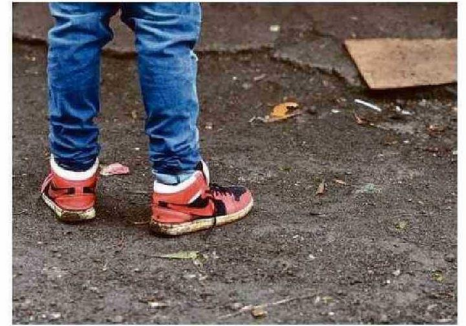
HAY 74 MENORES DE EDAD, DE ELLOS 8 SON LACTANTES.

Cabe señalar que la cifra de menores de edad tie-