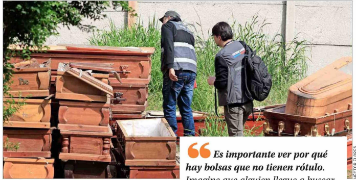
ATAÚDES. — Cajas mortuorias apiladas a metros de las bodegas y el crematorio hallaron también los fiscalizadores en su inspección.

El presidente de la Federación Nacional de Trabajadores de Ce-