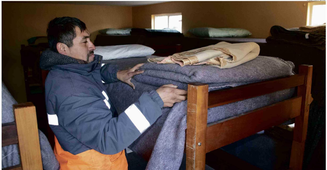
LOS ALBERGUES PÚBLICOS O PRIVADOS, COMO EL UBICADO EN RAHUE ALTO, AL LADO DE LA PARROQUIA SAN LEOPOLDO MANDIC, SON UNA OPCIÓN PARA PASAR LAS FRÍAS NOCHES.

Según reportes del Mideso, la cifra para 2024 de personas en situación de calle llegó a 21.272, donde la mayoría se concentra en la regiones Metropolitana, de Valparaíso y Bio Bio. En el caso de la Región de