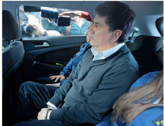
TRASLADO.— El exsubsecretario del Interior Manuel Monsalve fue trasladado ayer en la mañana desde un cuartel de la PDI en Ñuñoa, donde estuvo detenido el fin de semana, hasta el Centro de Justicia.