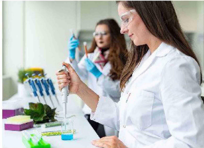
Bionorica® cuenta con procesos de cultivo controlados, es decir, con semillas patentadas seleccionadas, así como con métodos de cultivo estandarizados; y sistemas de producción de alta tecnología, patentados y desarrollados internamente para obtener la mejor calidad.

En la actualidad, los fitofármacos son empleados para tratar condiciones relativas a la salud como la gripe, el dolor de cabe-