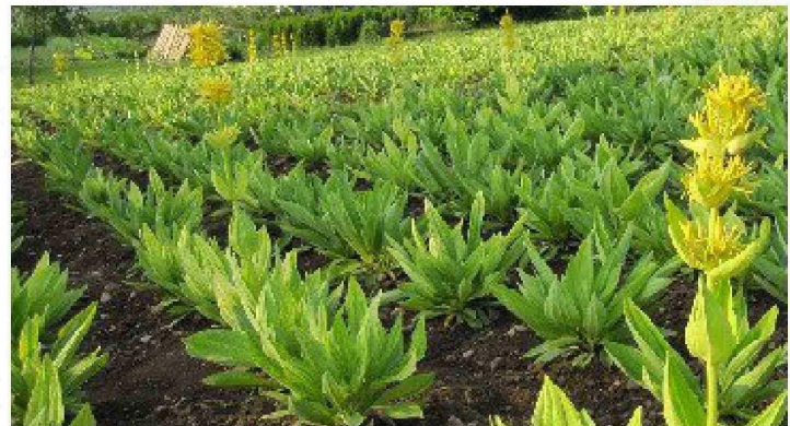
-Bionorica SE pone en marcha procesos de producción basados en la selección de la planta idónea, la identificación del mejor hábitat natural para el cultivo, el control de los diferentes factores que pueden ser determinantes para la cosecha y la aplicación de metodologías que contribuyen a la calidad de la materia prima.