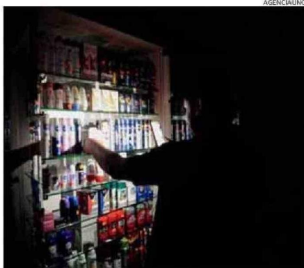
LA EMERGENCIA NO QUEDÓ RESUELTA ANOCHE.

fuerte tormenta con vientos de gran intensidad y lluvias torrenciales dejó sin electricidad a la capital, generó un caos similar y enervó a la población, que en ciertos sectores estuvo casi un mes sin suministro.