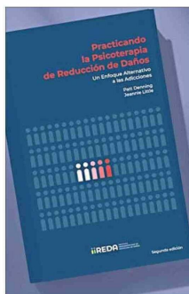
El libro “Practicando la psicoterapia de reducción de daños” fue traducido por primera vez al español.

Ambas están de visita en Chile para participar de las actividades enmarcadas en el seminario “Drogas y salud pública”, organizado por el Instituto Iberoamericano de Reducción de Daños (iiREDA) y el Servicio Nacional para la Prevención y Rehabilitación del Consumo de