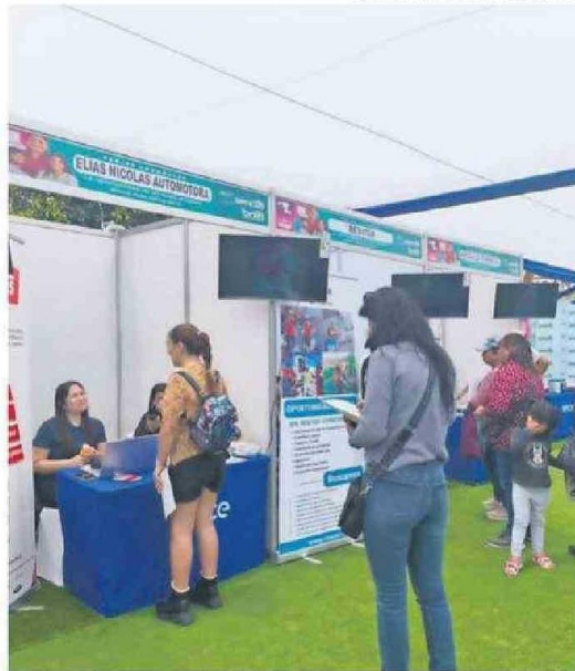
PESE A LA BAJA, ATACAMA TIENE LA SEGUNDA MAYOR BRECHA DEL PAÍS.

El seremi del Trabajo y Previsión Social de Atacama, Jo-