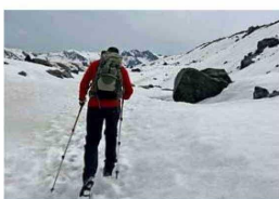
Solo se accede con guías certificados.