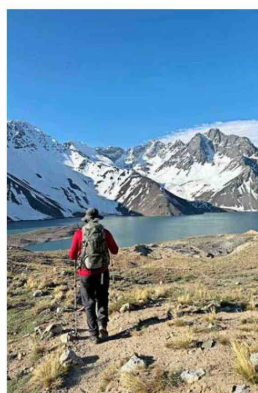
Menos del 1% del lugar tiene senderos.

N os subimos a la roca más grande, de unos cuatro metros en su punto más alto y donde cabrían fácilmente unas 30 personas. La idea es recrear la imagen que, en 1873, el intendente de Santiago Benjamín Vicuña Mackenna tomó junto a sus acompañantes aquí mismo, de espaldas a la laguna Negra, en una expedición que también incluyó la laguna del Encañado, en San José de Maipo.