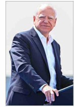
Profesor y entrenador de fútbol americano: la historia de Tim Walz, el elegido por Kamala Harris como candidato a vicepresidente. | 7